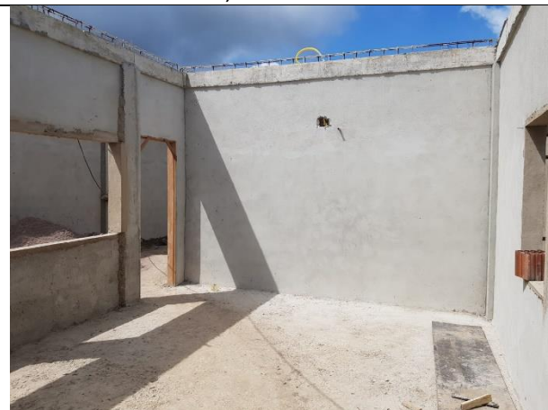
FOTO 10: Vigas concretadas, lastro de concreto e Reboco das Paredes;