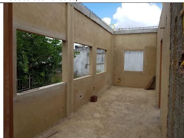
FOTO 12: Vigas concretadas, lastro de concreto e Reboco das Paredes;