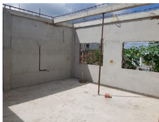
FOTO 7: Vigas concretadas, lastro de concreto e Reboco das Paredes;