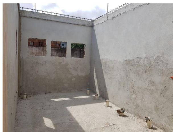
FOTO 14: Vigas concretadas, lastro de concreto e Reboco das Paredes;