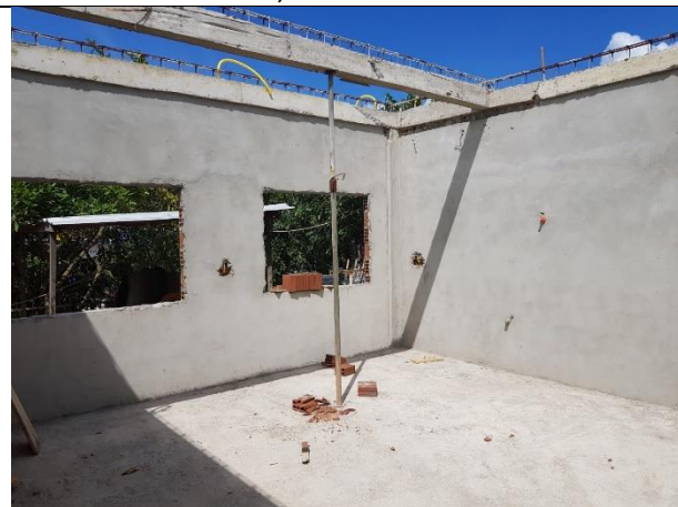
FOTO 9: Vigas concretadas, lastro de concreto e Reboco das Paredes;