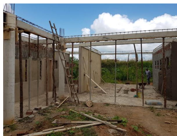
FOTO 8: Vigas concretadas, lastro de concreto e Reboco das Paredes;