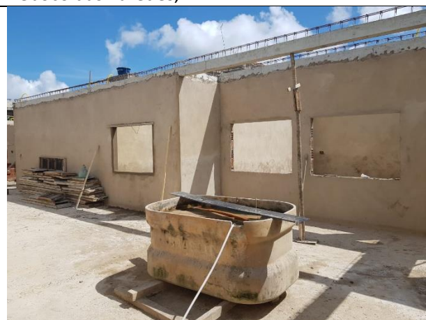
FOTO 11: Vigas concretadas, lastro de concreto e Reboco das Paredes;