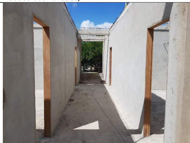
FOTO 16: Vigas concretadas, lastro de concreto e Reboco das Paredes;