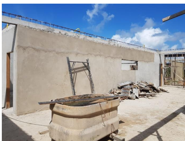
FOTO 13: Vigas concretadas, lastro de concreto e Reboco das Paredes;