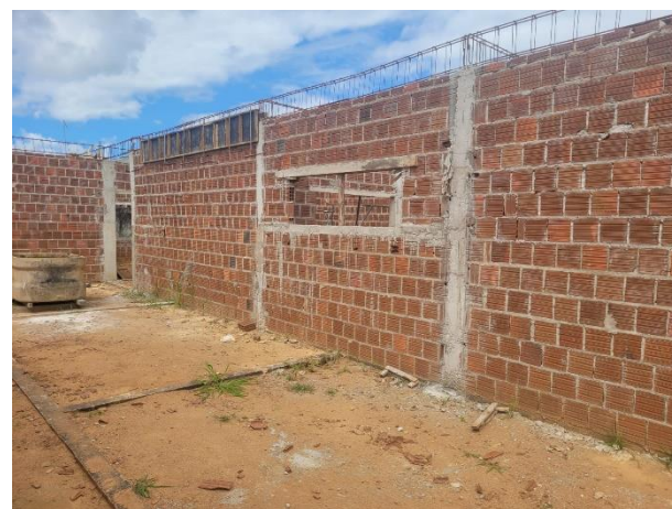
FOTO 6: Posicionamento de armações de vigas e Alvenaria de Vedação;