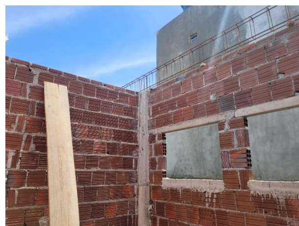
FOTO 4: Posicionamento de armações de vigas e Alvenaria de Vedação;