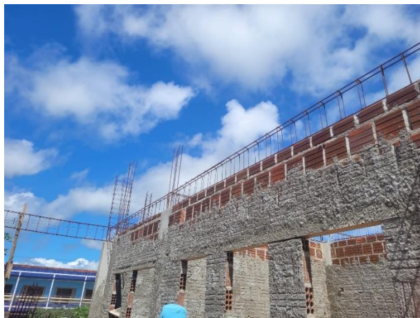
FOTO 7: Posicionamento de armações de vigas e Alvenaria de Vedação;